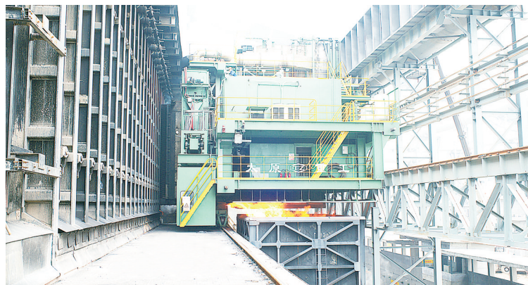
图为“有人值守，无人操作”智能化顶装型焦炉设备

焦炉机械作为炼焦生产流程中最核心的生产装备，在焦化产业实现节能减排、高效低耗中占有举足轻重的地位。集团在焦化装备行业中不断开拓进取，致力于为用户提供最具竞争力的产品，开发了适用于各种炉型的先进焦炉机械成套设备，形成了以“四车一机”（即装煤车、推焦车、拦焦车、电机车和提升机）为基础，各设备协调配合的产品格局，为用户提供装煤、推焦、接焦、熄焦的“一揽子”解决方案，有效助推焦化领域效能提升、节能降耗和转型升级。